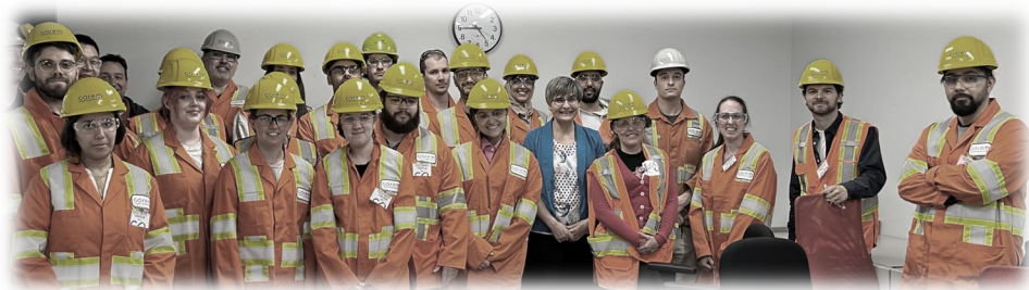
Juin 2023_ Visite chez Corem